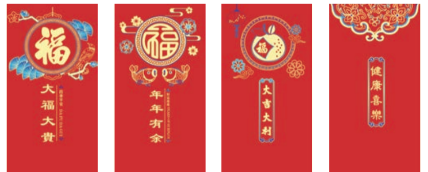
B-01 BB-01 B-02 BB-02 B-03 BB-03 B-04 BB-04