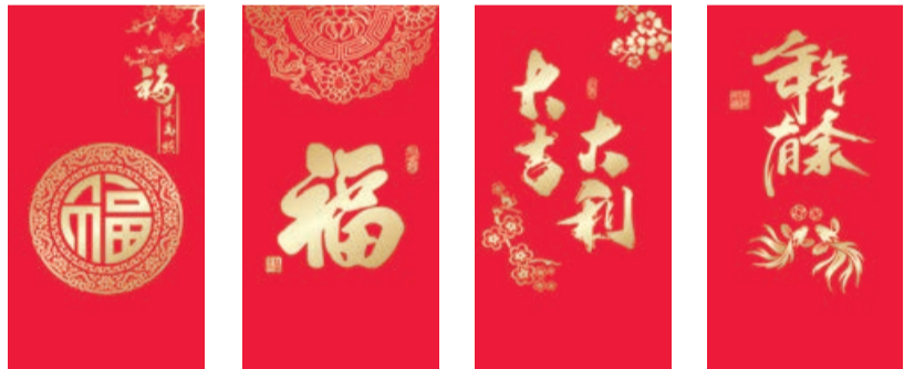
K-01 KK-01 K-02 KK-02 K-03 KK-03 K-04 KK-04