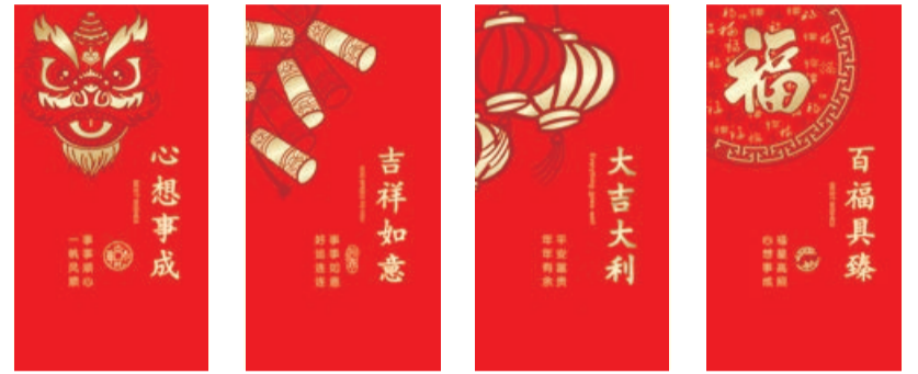
A-01 AA-01 A-02 AA-02 A-03 AA-03 A-04 AA-04