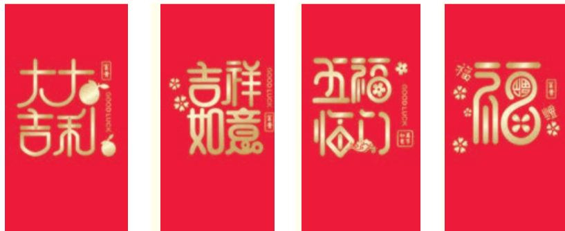
L-01 LL-01 L-02 LL-02 L-03 LL-03 L-04 LL-04