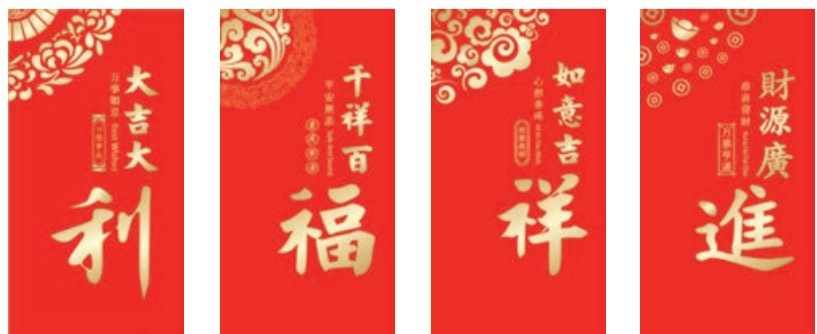
M-01 MM-01 M-02 MM-02 M-03 MM-03 M-04 MM-04