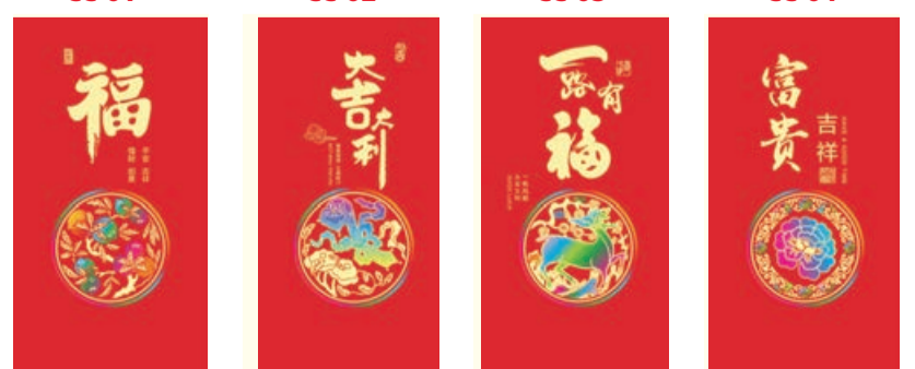
E-01 EE-01 E-02 EE-02 E-03 EE-03 E-04 EE-04