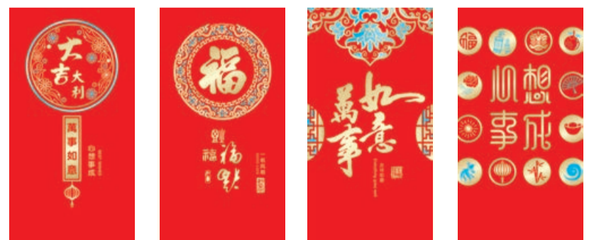
C-01 CC-01 C-02 CC-02 C-03 CC-03 C-04 CC-04