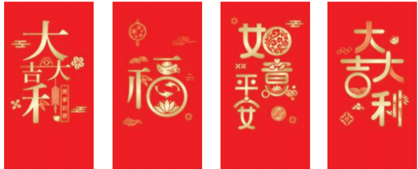
I-01 II-01 I-02 II-02 I-03 II-03 I-04 II-04