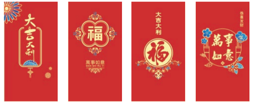
D-01 DD-01 D-02 DD-02 D-03 DD-03 D-04 DD-04