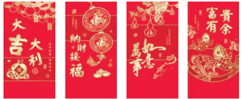
F-01 FF-01 F-02 FF-02 F-03 FF-03 F-04 FF-04